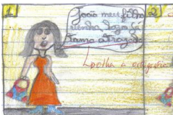
Quadrinho nº 1